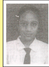
पंखुड़ी विद्या कक्षा VIII B