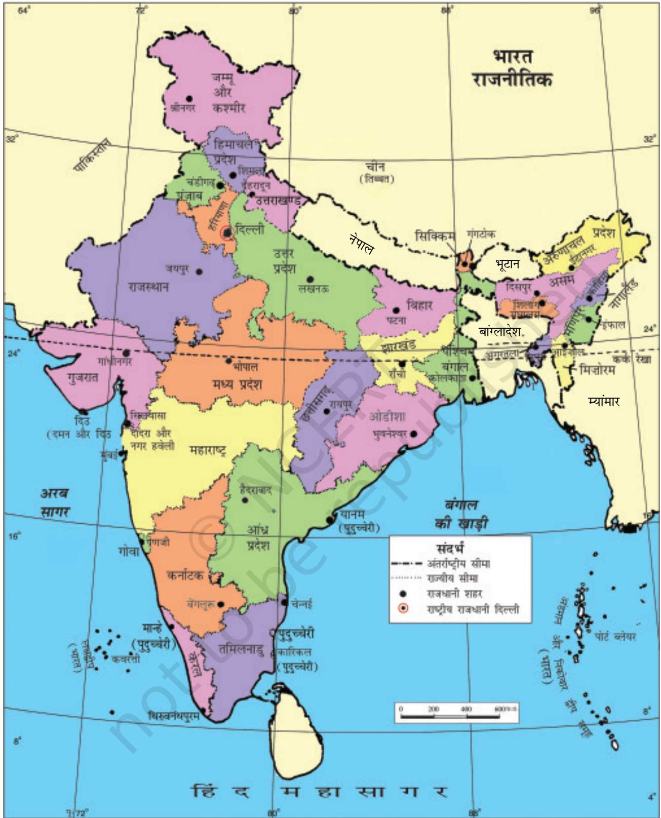
चित्र 7.2 : भारत का राजनीतिक मानचित्र

* जून 2014 में तेलंगाना भारत का 29वाँ राज्य बना