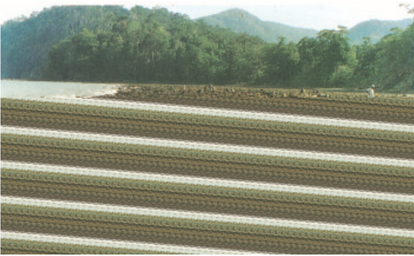
चित्र 7.4 : प्रवाल द्वीप