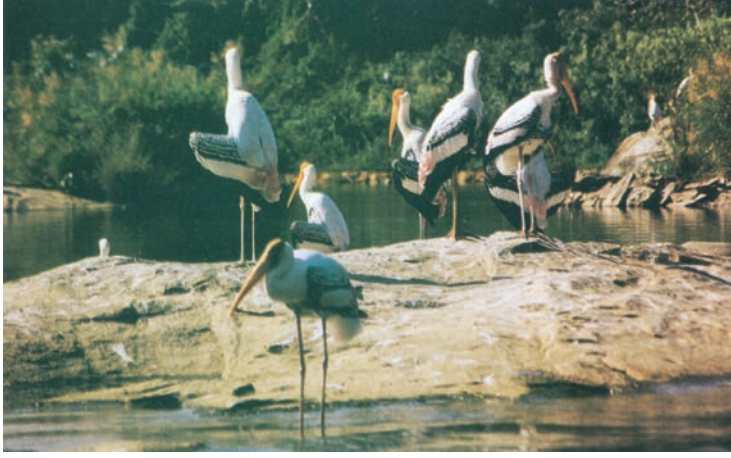
شکل 8.9 : لقلق۔ ایک مہاجر پرندہ