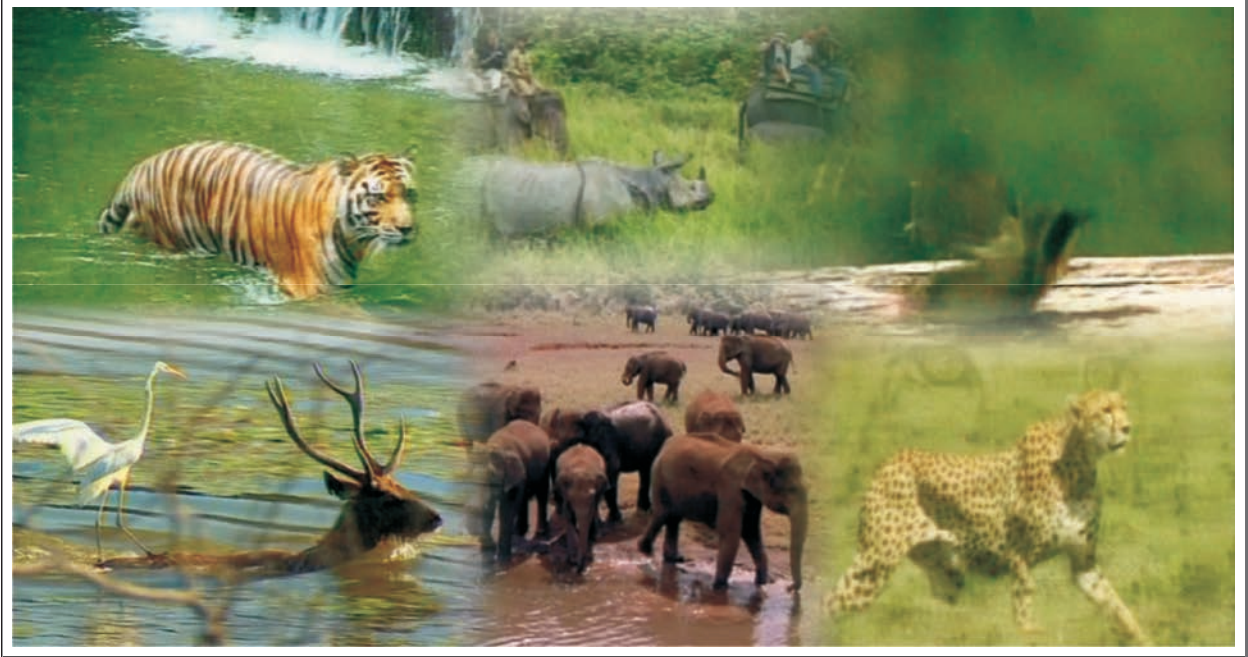
شکل 8.3 : جنگلاتی زندگی

ہیں۔ ان کا مقصد چڑیوں کو ان کی قدرتی پناہ گاہ مہیا کرنا ہے۔ یہاں پرندے شکاریوں سے بھی بچے رہتے ہیں۔ کیا آپ اپنے علاقے میں پائی جانے والی پانچ چڑیوں کے نام بتا سکتے ہیں؟