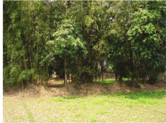
شکل 4.3: شمال مشرق میں بانس کے باغات