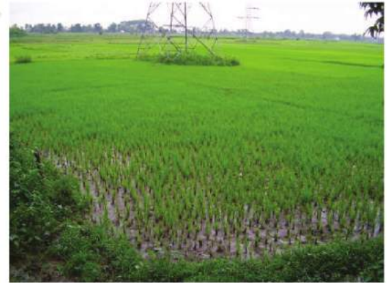
شکل (a) 4.4: چاول کی کاشت

چاول شمال اور شمال مشرقی ہندوستان کے ہموار ساحلی اور ڈیلٹا علاقوں میں پیدا ہوتا ہے۔ سینچائی نہروں اور ٹیوب ویل کے گھنے جال (Network) کے فروغ نے چاول کی پیداوار کو ان علاقوں مثلاً: پنجاب، ہریانہ اور مغربی اتر پردیش اور راجستھان کے کچھ حصوں میں بھی ممکن بنا دیا ہے جہاں بارش کم ہوتی ہے۔