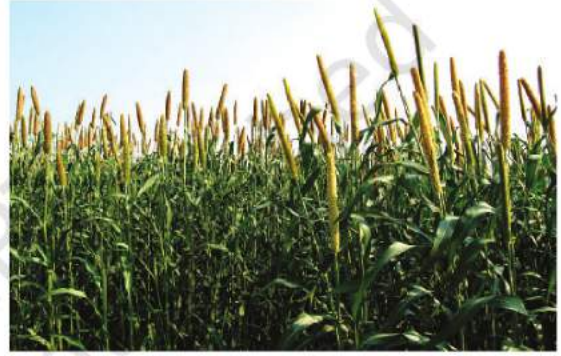
شکل 4.6: باجرہ کی کاشت

زیادہ لوہا، کمیشیم دیگر قلیل غذائی عناصر اور بھوسا پایا جاتا ہے۔ پیداوار اور علاقے کے اعتبار سے جواری تیسری اہم ترین غذائی فصل ہے۔ یہ ایک بارانی فصل ہے جو زیادہ تر نرم علاقوں میں پیدا ہوتی ہے جہاں سینچائی کی ضرورت شاذ و نادر ہی پڑتی ہے۔ مہاراشٹر 2011-12 میں کرناٹک، آندھرا پردیش اور مدھیہ پردیش جواری پیدا کرنے والی بڑی ریاستیں تھیں۔ باجرہ کی کھیتی ریتیلی مٹی اور کالی اٹھلی مٹی پر اچھی ہوتی ہے۔ 2011-12 میں راجستھان، اتر پردیش، مہاراشٹر، گجرات اور ہریانہ سب سے زیادہ باجرہ پیدا کرنے والی ریاستیں تھیں۔ راگی خشک علاقوں کی فصل ہے اور اس کی اچھی پیداوار لال، کالی، ریتیلی، نباتاتی کھاد والی اور اوپری کالی مٹی پر ہوتی ہے۔