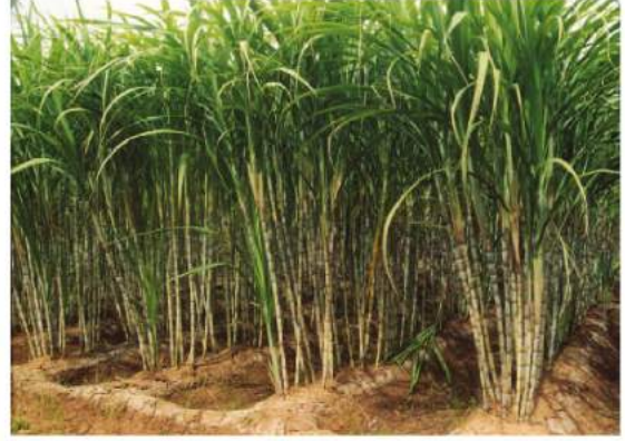
شکل 4.8: گنے کی کاشت

کافی: 2008 میں ہندوستان دنیا میں کافی کی پیداوار کا تقریباً 3.2 فیصدی حصہ پیدا کرتا ہے۔ دنیا میں ہندوستان کافی اپنی عمدہ خوبیوں کی وجہ سے جانی جاتی ہے۔ Arabica قسم جو ابتداً یمن سے لائی گئی تھی، ملک میں پیدا ہوتی ہے۔ کافی کی اس قسم کی پوری دنیا میں زبردست مانگ ہے۔ ابتداً اس کی کاشت Baba Budan پہاڑیوں پر شروع کرائی گئی تھی حتیٰ کہ آج بھی اس کی کاشت مخصوص طور پر کرناٹک کی تل گری، کیرل اور تمیل ناڈو تک ہی میں ہوتی ہے۔