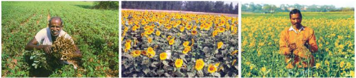
شکل 4.9: کھیتوں میں مونگ پھلی، سورج مکھی کا پھول اور سرسوں کٹائی کے لیے تیار ہے

مونگ پھلی خریف کی فصل ہے۔ ناریل ملک میں اہم تیل کے بیج کا تقریباً نصف کے برابر پیدا ہوتا ہے۔ آندھرا پردیش اور تمیل ناڈو کے بعد گجرات ناریل پیدا کرنے والی سب سے بڑی ریاست ہے۔ اسی اور سرسوں رینج فصلیں ہیں۔ تیل شمالی ہند میں خریف فصل ہے اور جنوبی ہندوستان میں یہ رینج فصل ہے۔ ارنڈی کا بیج رینج اور خریف دونوں فصلوں میں پیدا ہوتا ہے۔