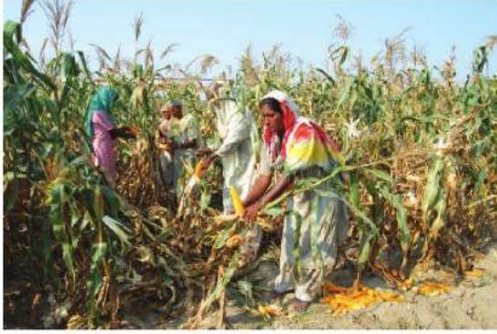
شکل 4.7: مکہ کی کاشت

دالیں: ہندوستان دالیں پیدا کرنے والا سب سے بڑا ملک ہے اور سب سے بڑا صارف بھی، ساگ، سبزی والی غذا میں یہ پروٹین کا اہم ترذریعہ ہے، ارہر، اژدہ، مونگ، مسور، مٹر اور چنا وغیرہ ہندوستان میں پیدا ہونے والی دیگر دالیں ہیں۔ کیا آپ دالوں کی ربیع کی فصلوں اور خریف فصلوں میں فرق کر سکتے ہیں؟ دالوں کو کم رطوبت کی ضرورت ہوتی ہے۔ یہ خشک موسم میں بھی پروان چڑھتی ہیں۔ ارہر کے علاوہ یہ تمام فصلیں ہوا سے نائٹروجن لیتے ہوئے مٹی کی زرخیزی کے دوبارہ حصولیابی میں مدد دیتی ہیں۔ اس لیے یہ فصلیں زیادہ تر دوسری فصلوں کے ساتھ باری باری بوئی جاتی ہیں۔ مدھیہ پردیش، اتر پردیش، راجستھان، مہاراشٹر اور کرناٹک ہندوستان میں دالیں پیدا کرنے والی اہم ریاستیں ہیں۔