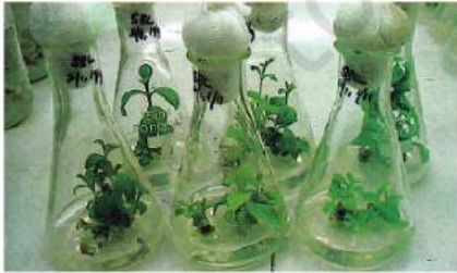
شکل 4.17 ساگو ان کے ریشوں پر مصنوعی مخلوطی عمل

آفاقیت کے تحت، بالخصوص 1990 کے بعد، ہندوستانی کسانوں کے سامنے نئے چیلنج اور مصیبتیں کھڑی ہو گئی ہیں۔ باوجود اس کے کہ ہم چاول، کپاس، ربڑ، چائے، کافی، پٹ سن اور مسالوں کے اہم پیدا کار ہیں، ہماری زرعی ایشیا ترقی یافتہ ملکوں کا مقابلہ نہیں کر سکتیں۔ اس کی وجہ یہ ہے کہ ان ممالک میں زراعت کو سرکاری اعانت اور بڑی رعایتیں حاصل ہیں۔