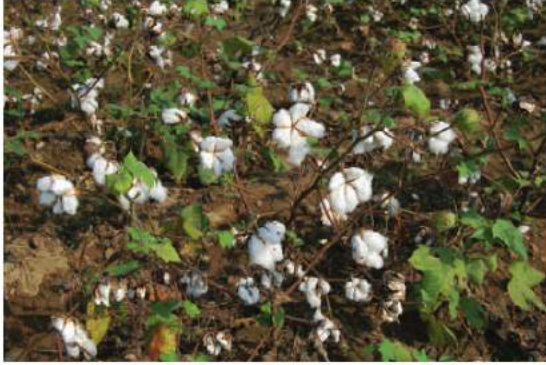
شکل 4.15: کپاس کی کاشت

ہوتی ہے۔ اور فصل تیار ہونے کے وقت اسے اعلیٰ درجہ حرارت کی ضرورت ہوتی ہے۔ مغربی بنگال، بہار، آسام، اڑیشہ، اور میگھالیہ جوٹ پیداوار کی اہم ریاستیں ہیں۔ اس کا استعمال بندوق بیگ، چٹائی، رسی، قالین اور دوسری دستی مصنوعات کے بنانے کے لیے ہوتا ہے۔ بہت زیادہ مہنگا ہونے کی وجہ سے یہ مصنوعی ریشہ، پیننگ والی ایشیا مثلاً نائلون کے مقابلے اپنی مارکیٹ کھور رہا ہے۔