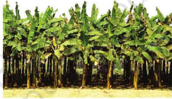
شکل 4.2: ہندوستان کے جنوبی علاقے میں کیلے کے باغات

ہندوستان میں چائے، کافی، ربڑ، گنا، کیلا وغیرہ اہم پیداواری فصلیں ہیں۔ آسام اور شمالی بنگال میں چائے، کرناٹک میں کافی۔ چند اہم باغی فصلیں ہیں جو ان ریاستوں میں پیدا ہوتی ہیں۔ پیداوار چوں کہ مارکیٹ کی خاطر کی جاتی ہے لہذا نقل و حمل اور مواصلات کا ایک عمدہ جال (Network) کھیتی باڑی کے ان علاقوں کو آپس میں جوڑتا ہے۔ اس طرح مارکیٹ ان فصلوں کی ترقی میں ایک نمایاں کردار نبھاتا ہے۔