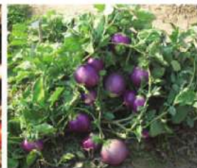
شکل 4.13: سبزیوں کی کاشت—مٹر، پھول گوہی، ٹماٹر اور بیگن