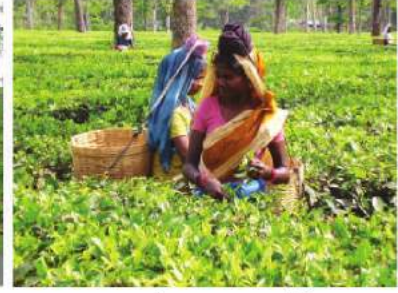
شکل 4.11: چائے کی پتی توڑنا

باغبانی والی فصلیں: 2008 میں ہندوستان چین کے بعد دنیا میں سبزیوں اور پھلوں کی پیداوار کرنے والا سب سے بڑا ملک تھا۔ یہاں گرم خطوں اور معتدل درجہ حرارت والے پھل پیدا کیے جاتے ہیں۔ مہاراشٹر، آندھرا پردیش، تلنگانہ، اتر پردیش، اور مغربی بنگال کے آم، ناگ پور اور چیراپونجی (میگھالیہ) کے سنترے، کیرل، میزورم، مہاراشٹر اور تمل ناڈو کے کیلے، اتر پردیش اور بہار کی بیجی اور امرود، میگھالیہ کے انناس، آندھرا پردیش