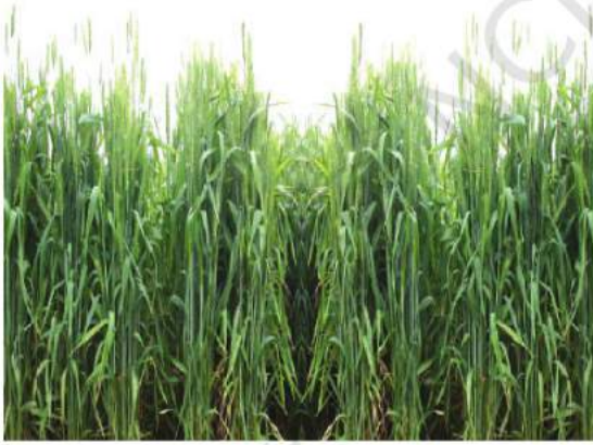
شکل 4.5: گگھوں کی کاشت

گگھوں: یہ دوسری اہم ترین اناج کی فصل ہے۔ ملک کے شمال اور شمال مغربی حصوں میں یہ اہم غذائی فصل ہے۔ اس ربیع فصل کو بڑھتے وقت ٹھنڈے موسم اور پکنے کے وقت تیز دھوپ کی ضرورت پڑتی ہے۔ فصل کے بڑھنے کے درمیانی موسم میں اسے پچاس سے پچتر سینٹی میٹر سالانہ بارش کی ضرورت ہوتی ہے۔ ملک میں دو اہم گگھوں کے پیداواری حصہ ہیں: شمال مغرب میں گنگا ستلج کے میدان اور دکن میں کالی پٹی والے علاقے۔ گگھوں پیدا کرنے والے اہم ریاستیں پنجاب، ہریانہ، اتر پردیش، بہار، راجستھان اور مدھیہ پردیش کے بعض حصے ہیں۔