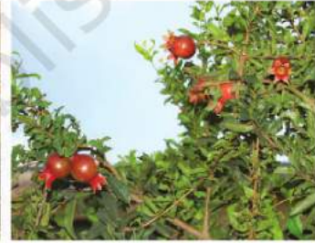
شکل 4.12: خوبانی، سیب اور انار

تلنگانہ اور مہاراشٹر کے انگور، جموں اور کشمیر اور ہماچل پردیش کے سیب، ناشپاتی، خوبانی اور اخروٹ کی پوری دنیا میں زبردست مانگ ہے۔ میں ہوتی ہے۔ 2010-11 میں دنیا کی قدرتی ربر کی پیداوار میں ہندوستان کا چوتھا مقام ہے۔