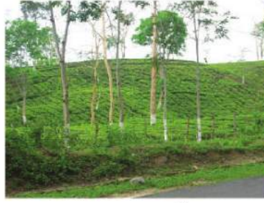
شکل 4.10: چائے کی کاشت

ربر ایک اہم صنعتی خام شے ہے۔ اس کی پیداوار زیادہ تر کیرل، تمل ناڈو، کرناٹک، جزائر انڈمان اور گوبار میگھالیہ کی گروپہاڑیوں