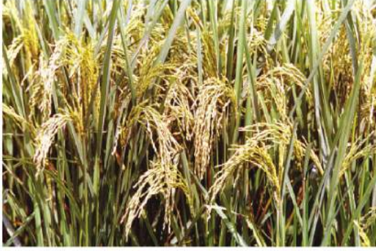
شکل (b) 4.4: چاول کھیت میں کتنے کے لیے تیار ہے

گگھوں: یہ دوسری اہم ترین اناج کی فصل ہے۔ ملک کے شمال اور شمال مغربی حصوں میں یہ اہم غذائی فصل ہے۔ اس ربیع فصل کو بڑھتے وقت ٹھنڈے موسم اور پکنے کے وقت تیز دھوپ کی ضرورت پڑتی ہے۔ فصل کے بڑھنے کے درمیانی موسم میں اسے پچاس سے پچتر سینٹی میٹر سالانہ بارش کی ضرورت ہوتی ہے۔ ملک میں دو اہم گگھوں کے پیداواری حصہ ہیں: شمال مغرب میں گنگا ستلج کے میدان اور دکن میں کالی پٹی والے علاقے۔ گگھوں پیدا کرنے والے اہم ریاستیں پنجاب، ہریانہ، اتر پردیش، بہار، راجستھان اور مدھیہ پردیش کے بعض حصے ہیں۔