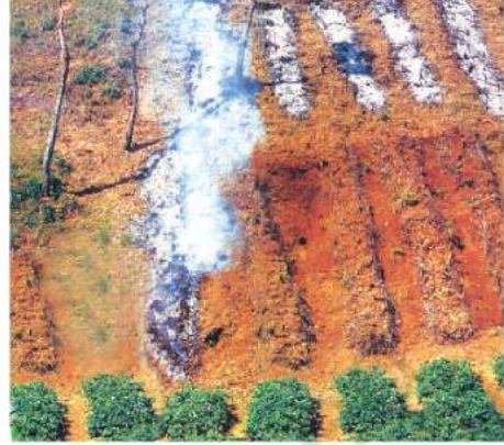
شکل 4.1: گیہوں کی کاشت

پردیش میں پینڈا (Penda) پاڈو (Podu)، اڈیشہ میں پاما ڈابی (Pama Dabi) یا کومان (Koman) یا برنگا (Bringa)، مغربی گھاٹ میں کماری (Kumari)، جنوب مشرقی راجستھان میں Valre یا Waltre، ہمالیائی علاقہ میں Khil، جھارکھنڈ میں Kuruwa اور شمال مشرقی علاقوں میں جھنگ کہا جاتا ہے۔