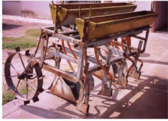
شکل 4.16: زراعت میں استعمال کیا جانے والا جدید ٹکنالوجی کا سازو سامان